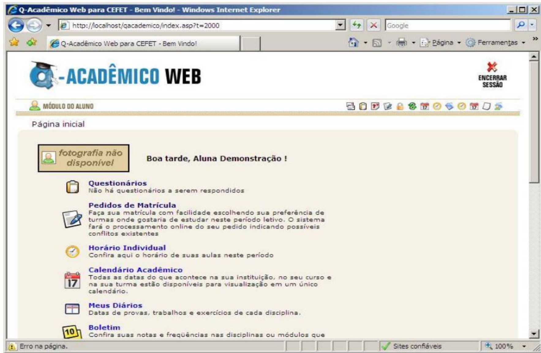
Figura 1 - Tela inicial do Q-Acadêmico exibindo a opção 'Pedido de Matrícula'

Você poderá ver esta opção na Figura 1 - Tela inicial do Q-Acadêmico exibindo a opção 'Pedido de Matrícula', demonstrada abaixo.